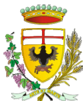
Comune di Acqui Terme