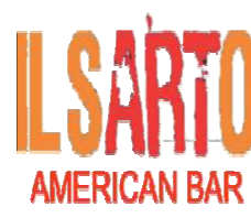
C.so Italia, Acqui Terme